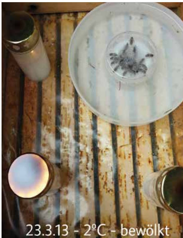
Abb.6: Candlelight-Dinner

großen Gaben erst ab Ende August nach der Wabenhygiene und ersten AS-Behandlung. Wer vorher füttert, egal wieviel, drückt das Brutnest künstlich nach unten und kann so die Altwaben in der unteren Zarge nicht mehr ernten. Zudem puffert frisches