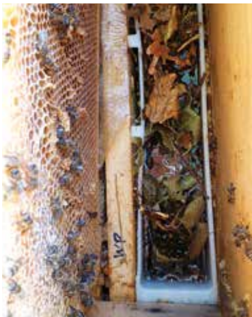
Abb.4: Bei kühlen Temperaturen wird Futter nur noch aus der Futtertasche geholt, wenn diese mit viel Ausstieghilfe neben oder bei Zweizargern unter der Bienentraube hängt.