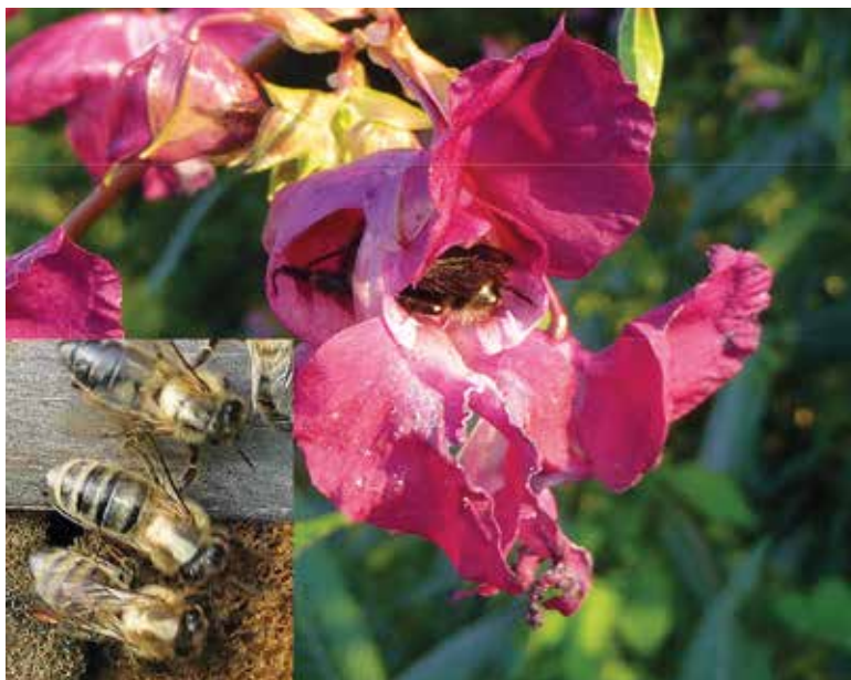
Abb.1: Blüht im Umfeld die Balsamine, versorgen sich Bienenvölker mit einem Teil des Winterfutters dort. Auch Hummeln schlecken daran.

Ich imkere im Bergischen Land und musste von August bis Oktober gar nicht füttern. Denn bis zu den ersten Nachfrösten blühte rundum die „Wupperorchidee“, das „Drüsige Springkraut“ ( Impatiens glandulifera ) (Abb.1). Fast jede Flugbiene kehrte mit einer weißen Markierung auf dem Rücken zurück. Nun mache ich mir Sorgen – Spättrachten schaden den Bienen bei der Überwinterung, oder?