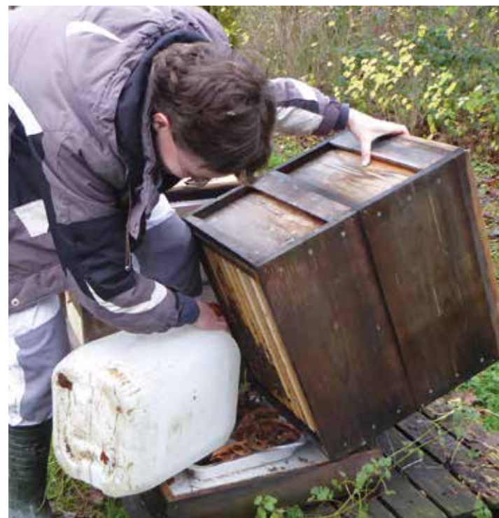
Abb.5: Im Boden unter der Bienentraube füttere ich nur wenn kein Flugwetter herrscht.

Aufgefüttert , also mit Winterfutterportionen versehen, werden meine zweizargig eingewinterten Wirtschaftsvölker in einer oder zwei