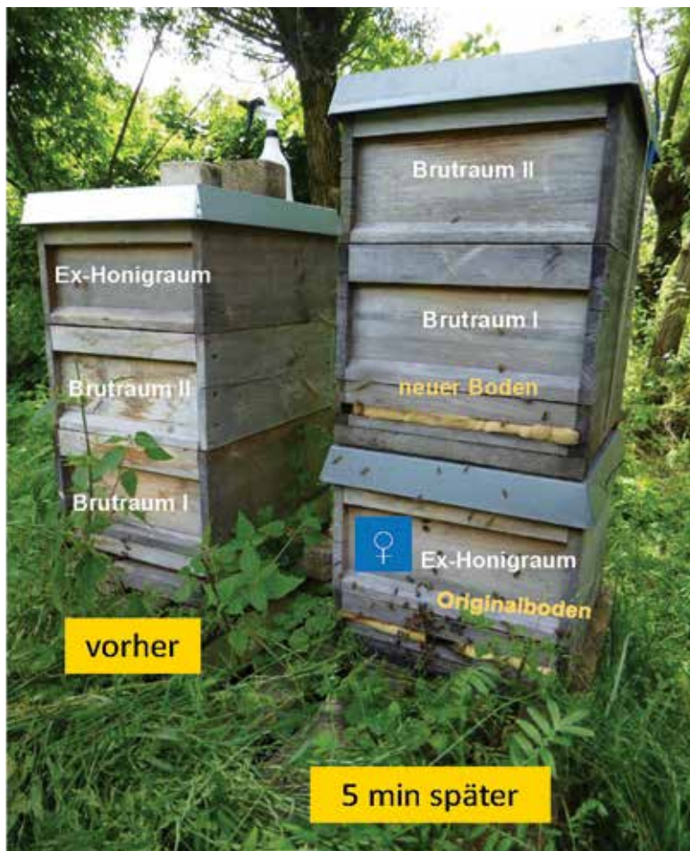
Abb.1: Mit etwas Übung ist die Teilung in weiselrichtigen Flugling und weisellosen Brutling in 5 Minuten erledigt. Fluglöcher einengen, besonders wichtig beim Brutling, der alle Flugbienen und Stockwachen verliert. Zwei Tage später folgt Schritt 2.