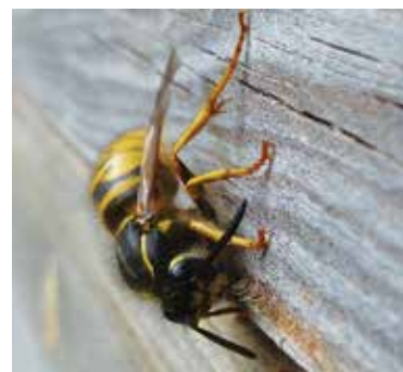
Abb. 3: Manche Wespen bevorzugen verwittertes Holz für den Nestbau. Wie gut, dass meine Beuten nicht gestrichen sind.

● Informieren Sie sich, z.B. bei www.aktion-wespenschutz.de , www.vademecumverlag.de . Nur zwei deutsche Wespenarten nerven manchmal. Die Deutsche und die Gemeine Wespe bilden individuenreiche Völker bis Mitte Oktober und sind als Einzige dreist und hungrig genug, um ungeladen zum Kaffeekränzchen oder Grillabend zu erscheinen oder sich für Bienenvölker zu interessieren. Meist entsorgen sie jedoch nur kranke und alte Bienen als Gesundheitspolizei vor dem Flugloch. Alle freihängenden Nester in Büschen und auf dem Dachboden sind hingegen schon im August verlassen. Freinister interessieren sich weder für Mensch noch für Biene. Die potentiellen Plagegeister hingegen sitzen unsichtbar in Bodennestern, in dunklen Rolladenkästen oder auf dem fensterlosen Dachboden. Deren erneuter Ansiedelung im nächsten April kön-