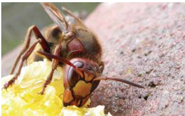
Abb. 2: Höre ich das sonore Brummen von Hornissen im Frühjahr an meinen Völkern a) freue ich mich und b) reiche den ermatteten Königinnen etwas Wegzehrung.

Arten und die auch nur von Juli bis September. Diese Aussagen helfen Thomas jedoch nicht weiter. Er macht sich Sorgen um seine Bienen. Hier kann ich beruhigen: Wespen sind vorsichtig. Mit intakten Bienenvölkern legen sie sich nicht an. Zwar lungern in „Wespenjahren“ etliche vor dem Flugloch herum und zerteilen halblebige Bienen vor den Stöcken. Genau DAS ist ja ihre Aufgabe: sie haben in der Natur einen hohen Stellenwert als Schädlingsbekämpfer und Kadaver-Verwerter. Sind die „Kadaver“ gegrillt und mit Würzsoße versehen, stört sie das auch nicht. Anders als häufig aus Imkermund zu hören, gelingt es Wespen jedoch nicht, intakte Völker zu schädigen.