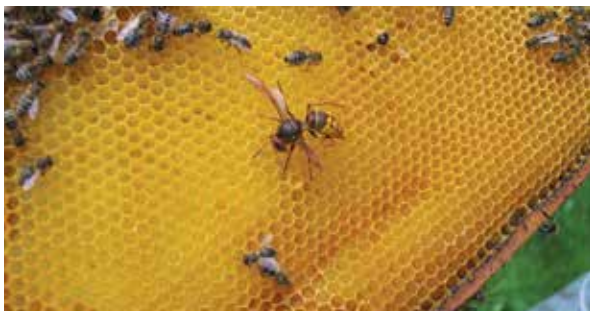
Abb. 1: Im kalten Mai hat eine Hornissenkönigin versucht, an Futtervorräte zu kommen. Sie hat dies mit dem Leben bezahlt.

Wespen sind manchmal lästig. Uns und unseren Bienen. Aber nur zwei