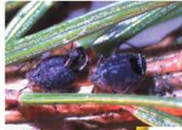
Kaum zu erkennen: 0,6 mm kleine Schlupfwespe auf Rainfarnblütenköpfchen

Schlupfwespen entwickeln sich in anderen Tieren, höhlen diese dabei aus. Ein grausiger Tod für die beiden Fichtenrindenläuse (Bild rechts); links schlüpft gerade eine Schlupfwespe aus der toten Laus, rechts ist das aufgeklappte Deckelchen zu erkennen.