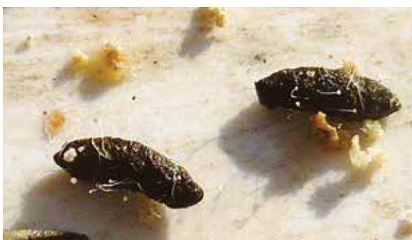
Abb. 2: Sogar Mäusekot wird von Pilzen verwertet.