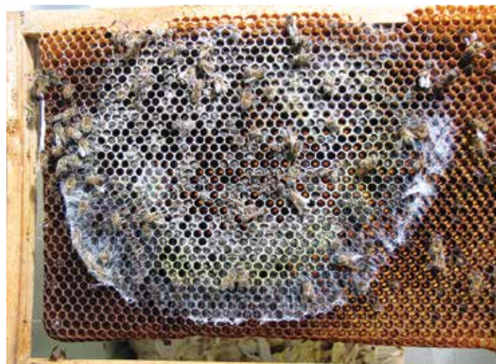
Abb. 8: Im verstorbenen Bienenvolk keimten die ersten Schimmelpilzsporen auf den toten Restbienen. Und breiten sich nun kreisförmig mit ihren Pilzfäden aus.