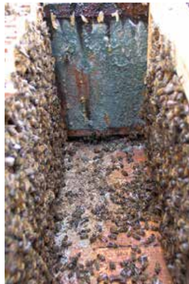
Abb.6: Solche Schimmelpeteten schafft man nur mit geschlossenen Böden.