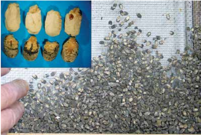
Abb. 4: Kalkbrutmumien finden sich im zeitigen Frühjahr nur in etwa jedem 100ten unserer Völker.

Von Jungimkern oft mit Sorge betrachtet wird der milchig-weiße Belag auf aktuell nicht mit Bienen besetzten Futterwaben oder auf Futter in verstorbenen Völkern (Abb.5). Das ist kein Schimmel! Sondern völlig unproblematische Ausblühungen des Deckelwachses nach stärkeren Temperaturschwankungen.