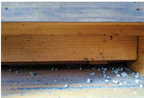
Abb. 1: Hausputz bei Bienen – nur WAS haben sie da vor die Tür gefegt?

Für Imker gilt: keep cool! Bienen leben seit Jahrmillionen mit Schimmel im Bau. Keine Baumhöhle, Strohkorb oder muckelig in Pferdedecken verpackte Behausung ist pilzfrei. Winterliche Stockflecken auf meinen Rähmchenoberträgern unter der Folie interessieren mich daher genauso wenig wie einzelne pilzige Zellen. Auch Kalkbrutmumien (Abb.4), also von einem Pilz durchwucherte und getötete Larven im zeitigen Frühjahr im Boden und vor dem Flugloch einzelner Völker erschrecken mich nicht. Abwarten, nach einigen Wochen ist das Phänomen vorbei. Von solchen Völkern ziehe ich allerdings nicht nach, denn die Anfälligkeit vererbt sich. Und im Herbst werden sowieso alle alten Königinnen getauscht.