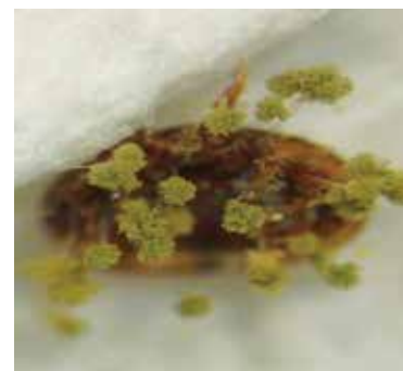
Abb. 3: Entomopathogene Pilze als biologische Schädlingsbekämpfung gegen Varroa sind noch Zukunftsmusik.