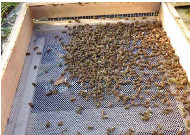
Abb. 7: Durchgehend offener Gitterboden und Mäusegitter. Wer so imkert, muss nicht mal mehr den Totenfall wegräumen.