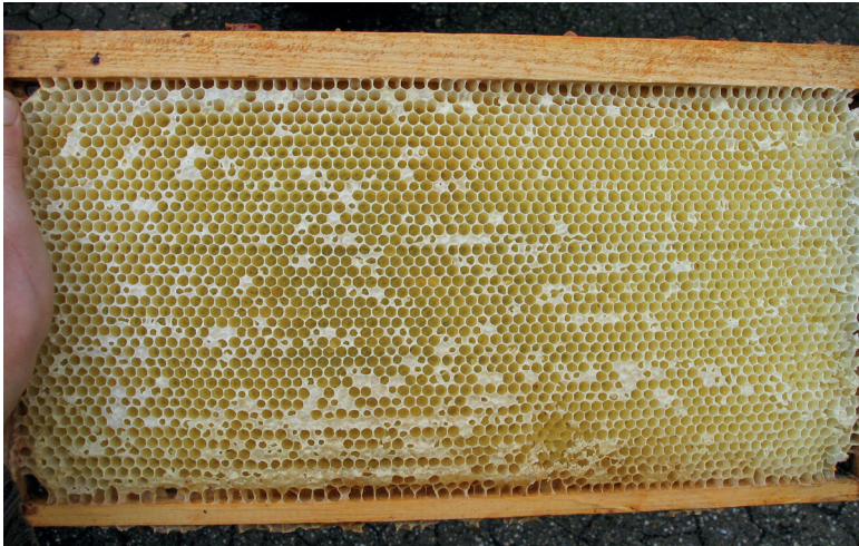
Abb. 2 und 3: Bitte nicht wundern! Mit Heißluft entdeckelt, verbleibt das Deckelwachs als kleines Klümpchen am Zellenrand. Bei den Reinigungsarbeiten basteln manche Bienen daraus direkt wieder ein neues Zelldeckelchen. Der darunter befindliche Zellraum ist leer. Also kein Handlungsbedarf für den Imker! Nur staunen.