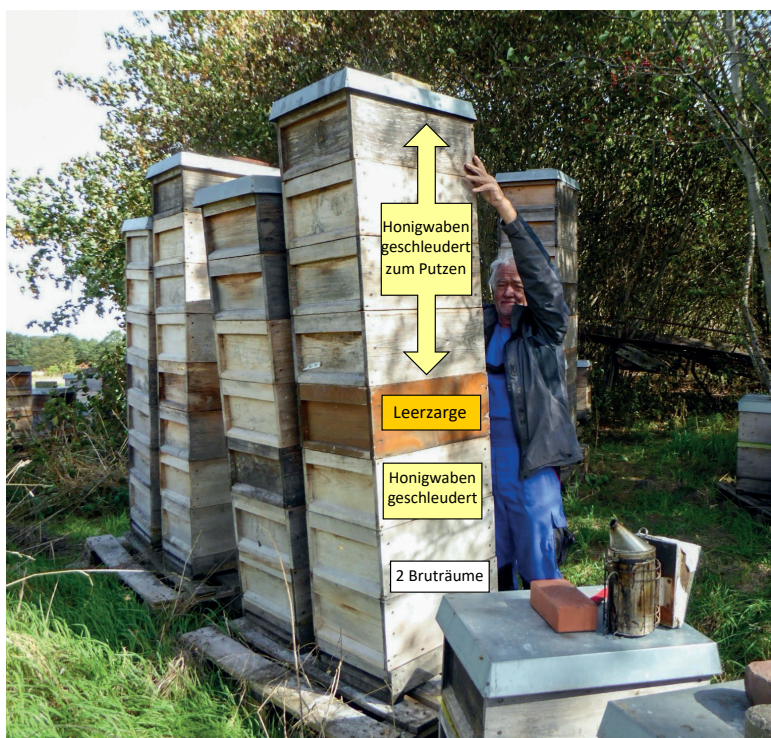
Abb. 1: Nach der Spättrachternte wird das Absperrgitter entnommen und einer der ausgeschleuderten Honigräume für die spätere Wabenhygiene über die Bruträume platziert. Positioniert man darauf eine Leerzarge und darüber, auf starken Völkern, weitere ausgeschleuderte Honigwaben, so werden diese schnell sauber und trocken geschleckt.

denn neben riesiger Räuberei mit wochenlang herumspirschenden Suchbienen verstößt dieses Vorgehen auch gegen die Bienenseuchenverordnung, die zum Schutz aller Imkernden vor Bienenseuchen Regeln setzt.